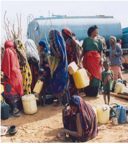
የውሀ አቅርቦትን በተመለከተም

በአመዘኔ ፣ ችግሩ በተከሰተባቸው ክልሎች መንግሥታትና መንግሥታዊ ባልሆኑ ድርጅቶች አማካይነት በሱማሌ ክልል ከ65 በላይ በአሮሚያ ቦረና ዞን 14 ቦታዎች ተመድበው የውሃ እጥረት በተከሰተባቸው አካባቢዎች የውሀ ዕደላ በማከናወን ላይ ይገኛሉ።