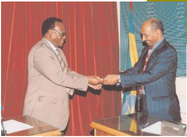
ከተለገሰው ጠቅላላ የዕርዳታ መጠን ውስጥ ብር 35 ሚሊዮን 238 ሺህ 213 ከ50 ሳንቲም በጥሬ ገንዘብ ቀሪው ብር 10 ሚሊዮን 806 ሺህ 756 ከ14 ሳንቲም ደግሞ በዓይነት የተለገሠ መሆኑን ለመረዳት ተችሏል።

ባሉት ሶስት ወራት ውስጥ ቁጥራቸው ከ980 በላይ የሆኑ የመንግሥትና መንግስታዊ ያልሆኑ ድርጅቶች እና ሠራተኞቻቸው ፣ የልማት ድርጅቶች ፣ ማህበራት ፣ የግል ድርጅቶች ፣ የሀይማኖት ተቋማት ፣ የክልል መንግስታት ፣ የመከላከያ ሠራዊት አካላት ፣ የፖሊስ አካላት እና ግለሰቦች ከብር 5 ጀምሮ እከከ ብር 1.4 ሚሊዮን የሚደርስ ዕርዳታ የለገሡ መሆኑን ለማወቅ ተችሏል።