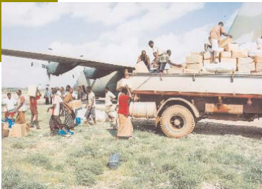
ለተጎጂ ወገኖች ከተመደበው 19 ሺህ 721 ኩንታል የአስቸኳይ ጊዜ ምግብ ዕርዳታ ውስጥ 19 ሺህ ኩንታል የምግብ እህል፣ አልሚ ምግብ ፣ ጥራጥሬና ዘይት በጭነት ተሽከርካሪዎች ጉዳቱ ወደደረሰባቸው አካባቢዎች መጓጓዣ እንዲሁም እንደችግሩ ስፋትና መጠን እየታየ ተጨማሪ የአስቸኳይ ጊዜ ምግብና ቁሳቁስ ዕርዳታዎች በተከታታይ ወደ ስፍራው ለማጓጓዣ ዝግጅት መደረጉንም ለማረጋገጥ ተችሏል።

ሚኒስትርና የግብርናና ገጠር ልማት ሚኒስትር አቶ አዲሱ ለገሠ አደጋው ባለፈው ክረምት በሀገሪቱ የተለያዩ አካባቢዎች የደረሱት የጎርፍ አደጋዎች ካደረሱት ጉዳት ባላገገምንበት እና ባልታሰበ ወቅት የደረሰ እና ያስከተለውም ጉዳት በዓይናችን እንዳየነው ከፍተኛ እና አሳዛኝ ነው ካሉ በኋላ በውሃ ተከበው ለህይወታቸው አስጊ በሆነ