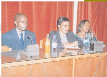
ባለፈው ዓመት ክረምት በተከሰቱ የጎርፍ አደጋዎች በደቡብ አሞ ዞን ፣ በድሬዳዋ ፣ በሱማሌ ክልል ጎዴ ዞን ፣ በጋምቤላ ክልል እና በአፋር ክልል በተወሰኑ ወረዳዎች ከቤት ንብረታቸው የተፈናቀሉና ጉዳት የደረሰባቸውን ወገኖች መልሶ ለማቋቋም የሚከናወኑ ተግባራት በተጠናከረ መልኩ እየተካሄዱ መሆኑ ተገልጿል።

አድርገውላቸዋል። ባለሥልጣናቱም የአደጋ ሁኔታዎችን በይፋ በማሳወቅ ረገድ ኤጀንሲው የሚከተለውን የግልፅነት አሠራርና ሰብዓዊ ዕርዳ በወቅቱ ከማድረስ አኳያ ያለውን ልምድ እንዲሁም